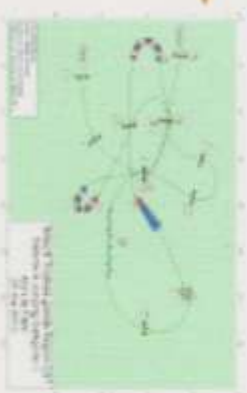
Schéma de parcours le plus demandé : Jumping de la manche 4 du Trophée par équipe de la catégorie C

Reunion CEACR, MFR de Semur en Auxois, septembre 2010