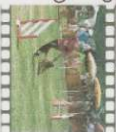
Photo la plus regardée : Le podium du sélectif du Trophée par équipe pour les poussins de la catégorie A, vue 130 fois

13000 vidéos visionnées dont 7200 pour la finale du GPF. Vidéo la plus demandée : UP and GO (Berger Belge malinois) dans la manche 4 du Jumping de la catégorie C, finale GPF 2010, vue 245 fois